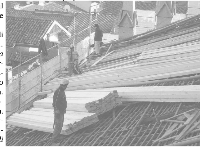
Il tetto della navata di destra in piena ristrutturazione

Dobbiamo togliere da noi tutte quelle forme che perpetuano una mentalità di violenza, di